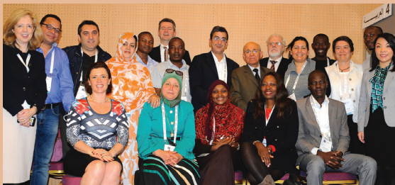
Membres d'AFRALO et de la communauté At-Large à la 55e réunion de l'ICANN à Marrakech, mars 2016.

Grâce à une vaste campagne de sensibilisation, plusieurs structures At-Large (ALSes) ont rejoint AFRALO ces dernières années. Plus de 44 ALSes représentant 25 pays de la région africaine font partie d'AFRALO. Les structures At-Large peuvent être des organisations non gouvernementales, des associations d'internautes locaux ou des activistes des TIC. Elles travaillent au renforcement des capacités des communautés défavorisées, à la promotion des logiciels libres, au développement de la culture, de la santé et de l'environnement, ainsi qu'au développement humain dans le continent à l'aide de l'Internet.